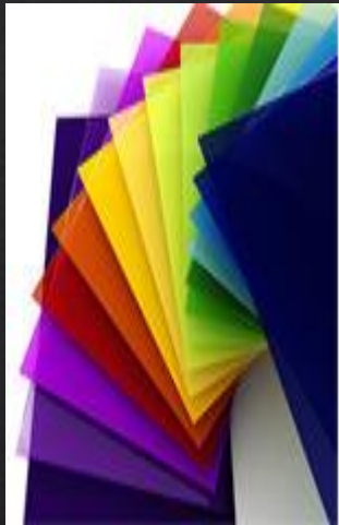
Акрил прозрачный / цветной