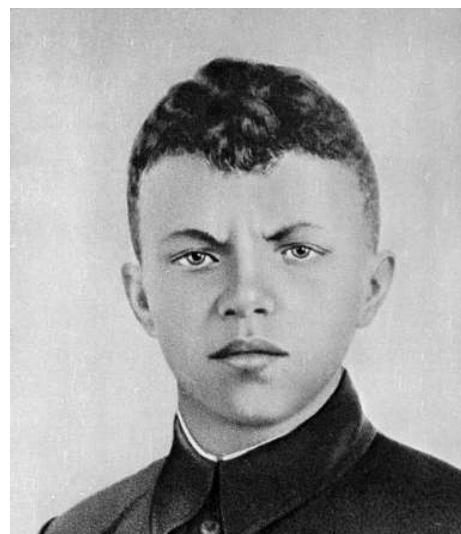
Александр Матвеевич Матросов

Александр Матвеевич Матросов работал в Куйбышеве. Когда началась война, его зачислили в роту автоматчиков. Наступил день, когда их стрелковая бригада получила приказ выступить на передовую. 200 километров прошли они, от станции Земцы до места назначения – Большо-