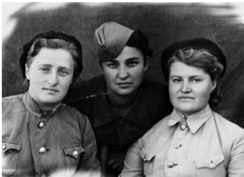
Нонна Викторовна (по середине) с боевыми подругами

Рассказ назывался – «ЛИ-2 с задания не вернулся». В статье рассказывалось о всех членах экипажа, приводились фотографии погибших летчиков и дальнейшая судьба оставшихся в живых.